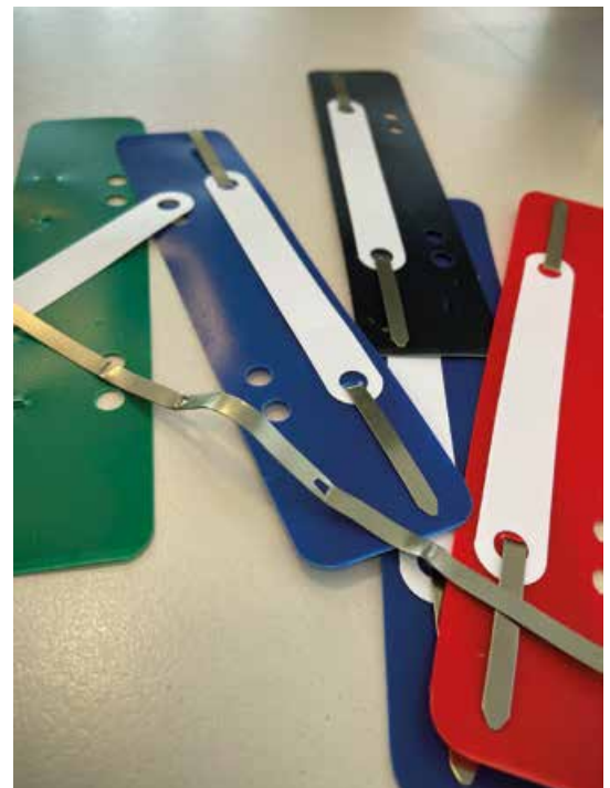
Die Metall-Heftzunge eines Heftstreifens eignet sich sehr gut zur Verstärkung der Nase.