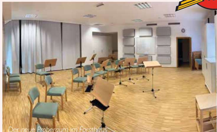
Der neue Proberaum im Forsthaus

Die Jugendblasmusik der FF Hornstein nutzte bis zuletzt seit über 30 Jahren mehrere Räume der Alten Schule für verschiedene Zwecke, etwa als Proberaum oder Lager für Noten, Uniformen und Veranstaltungstechnik. Speziell im Erdgeschoß mussten wir all die Jahre mit verschiedenen baulichen Umständen und Mängeln kämpfen und uns arrangieren. Hauptsächlich geht es dabei um das feuchte Mauerwerk, das neben optischen Einbußen auch zu gesundheitlichen Sorgen unserer Musiker und derer Eltern geführt hat. In manchen Räumen, wo es mangels Fenster bzw. menschlicher Frequentierung zu wenig Luftzirkulation kommt, kam es sogar zu massiver Schimmelbildung auf gelagertem Equipment und Gegenständen. Nebenher sind auch die Sanitäreinrichtungen in der Alten Schule in einem sehr schlechten Zustand.