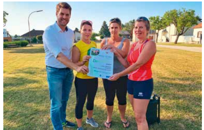
Gesundheit - Fit im Park