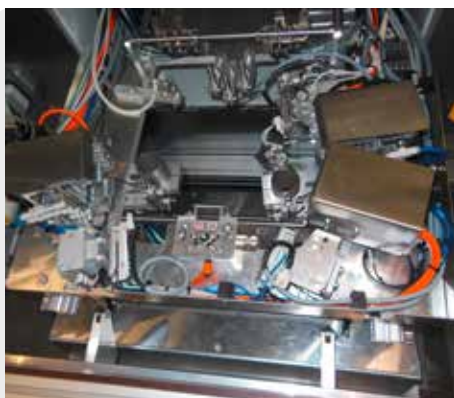
Sondermaschine - Teilausschnitt

Rufen Sie uns an – unsere Mitarbeiter unterstützen Sie!