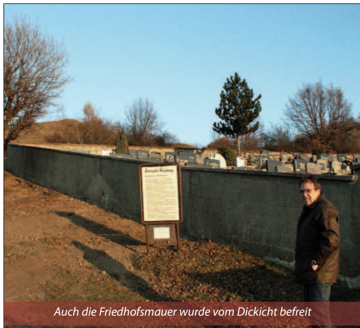
Auch die Friedhofsmauer wurde vom Dickicht befreit