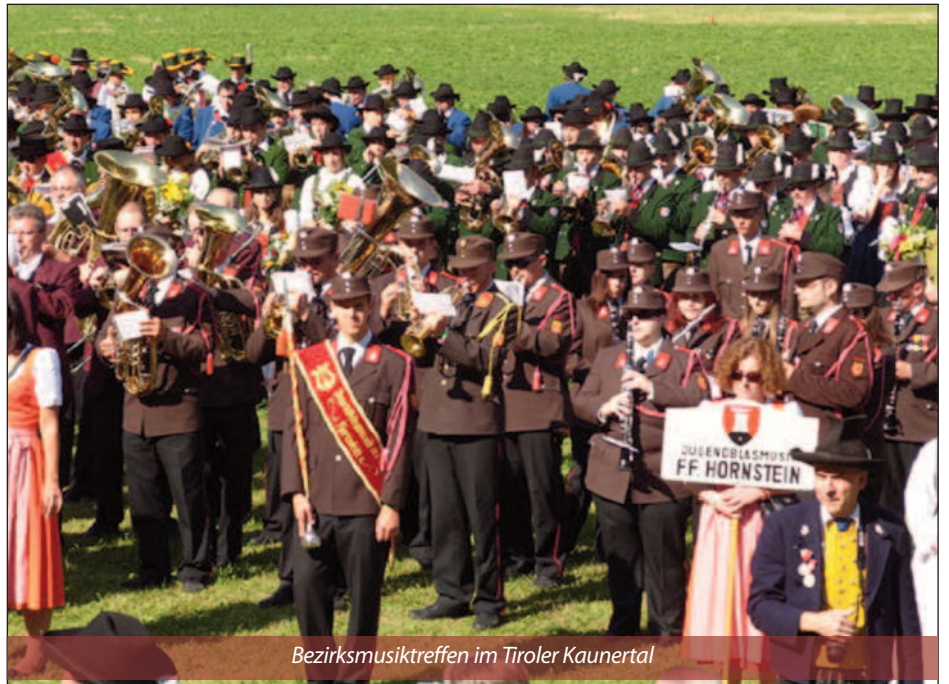
Bezirksmusiktreffen im Tiroler Kaunertal

V om 8. bis 10. Juli waren wir Gäste bei einem Bezirksmusiktreffen im Tiroler Kaunertal in der Gemeinde Feichten. Nach der 8-stündigen Anreise mit dem Kutsernits Bus konnten wir mit dem ersten Abmarsch auch gleich die Gemeinde inmitten der Tiroler Alpen und das riesige Festzelt begutachten. Mit der Gruppe VOLXROCK ging es dann bis in die frühen Morgenstunden weiter. Samstag konnten wir den Kaunertalglacier auf luftigen 3108 Metern besuchen und beim Tiroler Mittagessen den funkygen Klängen unserer Musikantenkollegen aus Holland lauschen. Am Abend konnten wir mit unserem Gästekonzert das Festzelt rocken und mussten dann nur mehr der Abendmusik "Servus aus Tirol" weichen. Sonntag spielten wir zusammen mit 30 weiteren Kapellen und insgesamt über 1400 Musikanten eine Feldmesse und marschierten anschließend ins Zelt zum Frühschoppen. Nach dem Frühschoppen ging es für unsere mitgereisten Fans und uns wieder mit dem Bus in die Hornsteiner Heimat.