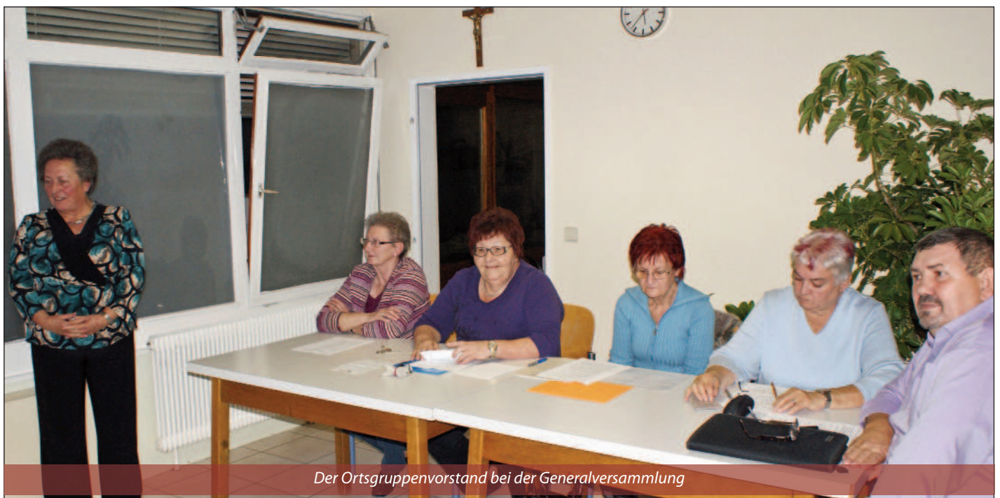
Der Ortsgruppenvorstand bei der Generalversammlung

Dezember – Ausflug zur Weihnachtsausstellung auf Schloss Kornberg und einem Konzert mit berührenden Weihnachtsliedern und Geschichten. Den Abschluss bildet unsere Weihnachtsfeier mit musikalischen Vorträgen von Hornsteiner Kindern.