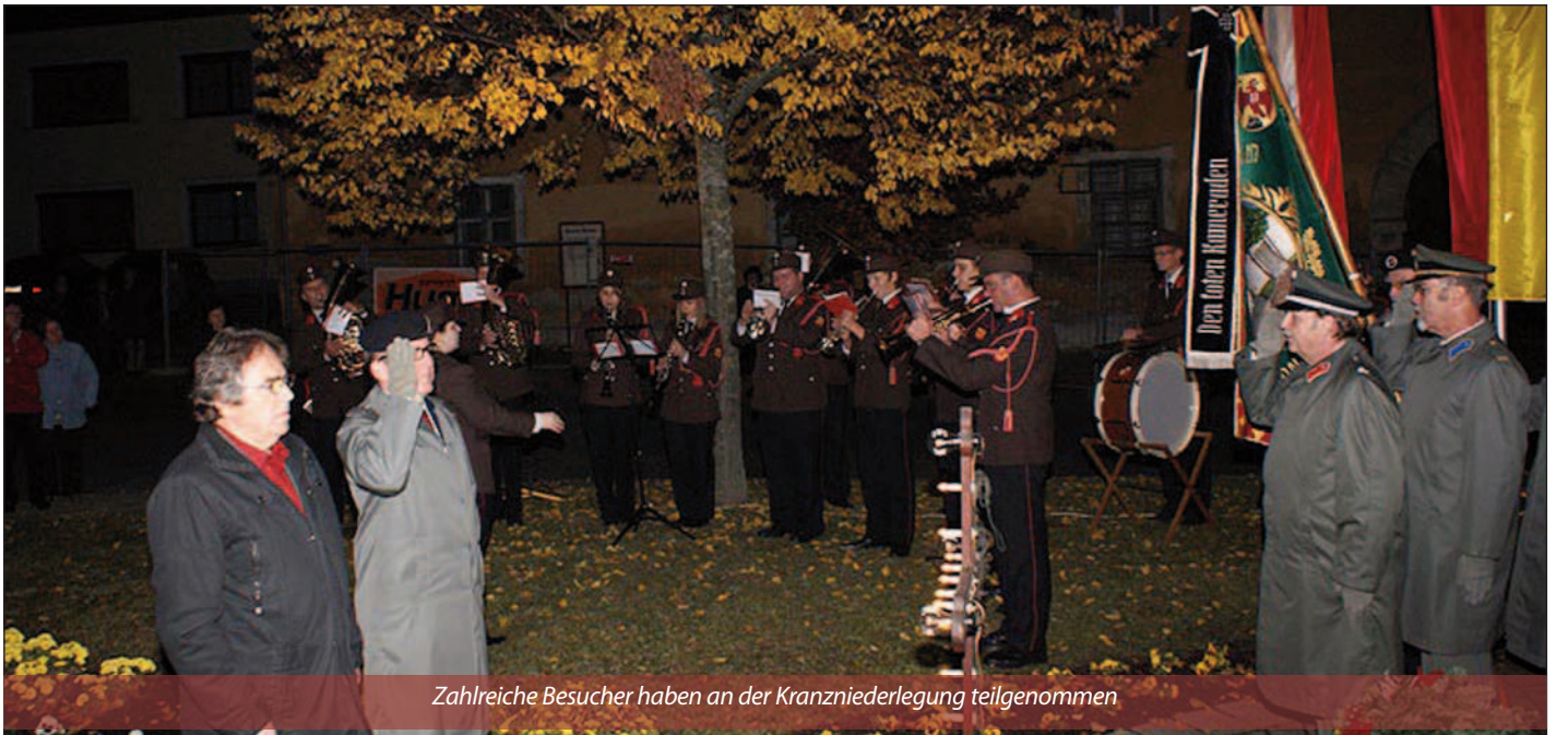
Zahlreiche Besucher haben an der Kranzniederlegung teilgenommen

Der Kameradschaftsbund Hornstein wünscht allen Hornsteinerinnen und Hornsteinern ein gesegnetes Weihnachtsfest und einen guten Rutsch ins Jahr 2012.