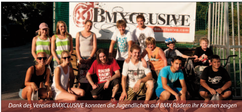
Dank des Vereins BMXCLUSIVE konnten die Jugendlichen auf BMX Rädern ihr Können zeigen