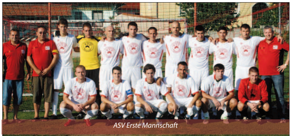
ASV Erste Mannschaft