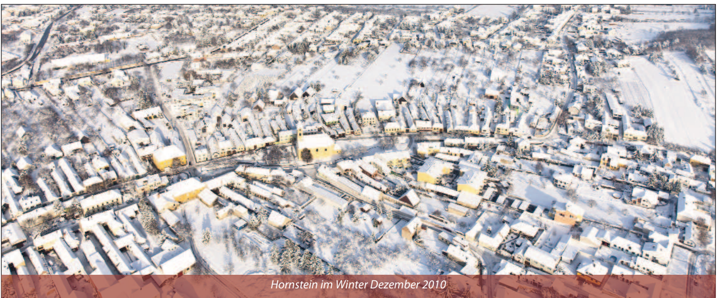
Hornstein im Winter Dezember 2010