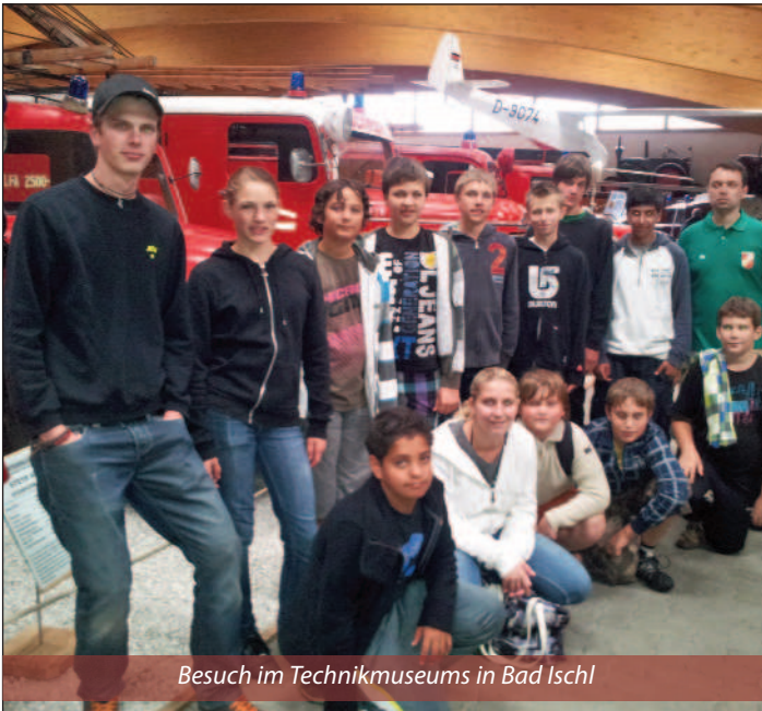
Besuch im Technikmuseums in Bad Ischl

am Wolfgangsee gepflegten sich die Jugendbetreuer und Jugendlichen selbst, es wurde vom jeweils eingeteilten Küchendienst gekocht und selbst zusammengeraumt. Die Jugendlichen waren von der Woche am Wolfgangsee begeistert und freuen sich schon auf die nächste Erlebniswoche.