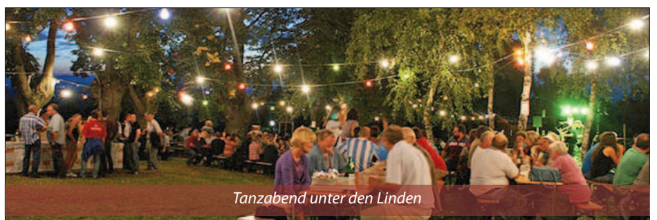
Tanzabend unter den Linden