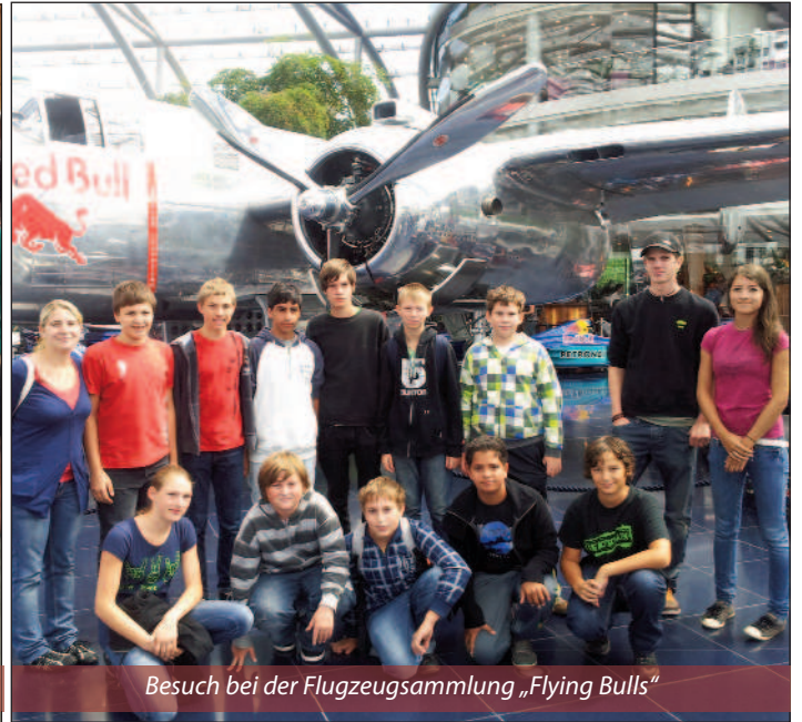
Besuch bei der Flugzeugsammlung „Flying Bulls“