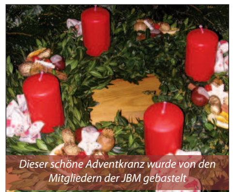
Dieser schöne Adventkranz wurde von den Mitgliedern der JBM gebastelt

M it unserem Adventbasar am 25. November im Pfarrsaal Hornstein leiteten wir die heurige Adventzeit ein. Um 16 Uhr ging es mit dem Basar und musikalischer Unternehmung los. Mit Glühwein oder Kinderpunsch und einem Gläschen Uhudler ließ sich die Zeit bis Weihnachten noch leichter überbrücken. Für die wetterfesten Freunde bot sich auch unser Glühweinstand beim Rathaus an, wo auch der Christbaum aus der Partnergemeinde Gnesau aufgestellt wurde.