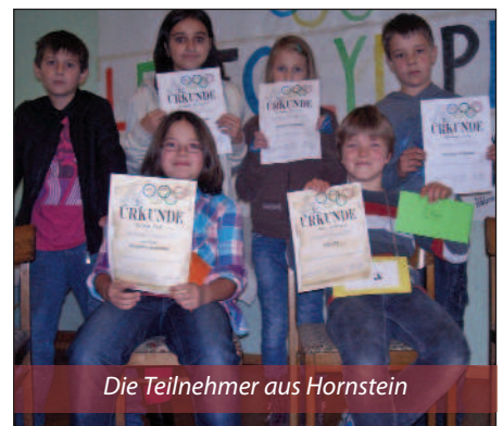
Die Teilnehmer aus Hornstein