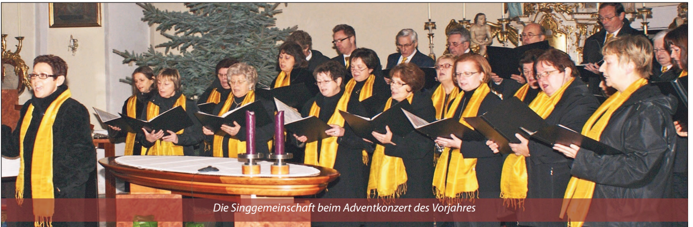
Die Singgemeinschaft beim Adventkonzert des Vorjahres