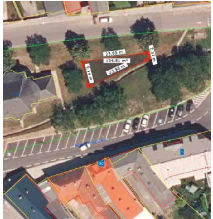
Fläche hinter der Kirche entlang des Baches (ca. 170m 2 )