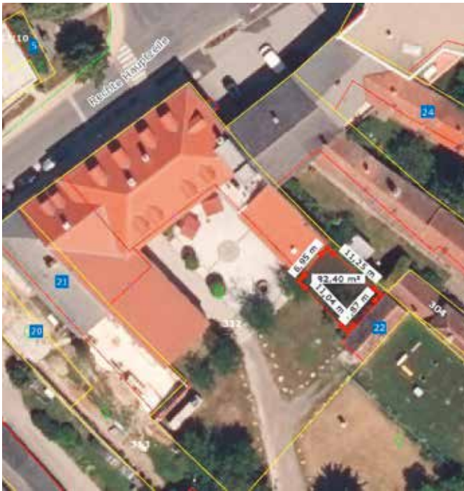
Fläche im Forsthaus-Garten zwischen Laube und kleiner Scheune (ca. 82m 2 )