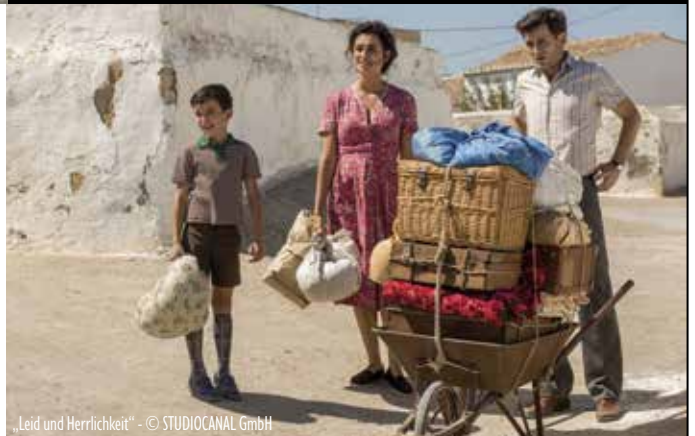
„Leid und Herrlichkeit“

Das neue preisgekrönte Meisterwerk des spanischen Regisseurs Pedro Almodóvar zeigt in atemberaubenden Bildern eine Selbstreflexion gemischt mit Fiktion. Antonio Banderas spielt den Filmregisseur Salvador Mallo, gezeichnet von Drogensucht und Krankheit. Er blickt auf sein Leben, die Beziehung zu seiner strengen Mutter (Penélope Cruz) und die verflossene Liebe zu verschiedenen Männern zurück. Witzig, intelligent und sinnlich pendelt „Leid und Herrlichkeit“ zwischen Drama und Komödie.