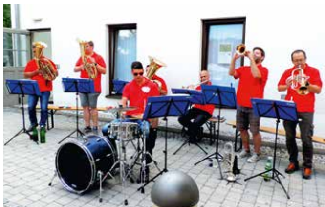
Immer mit Spaß bei der Sache - Hier beim Gassenheurigen der JBM 2019