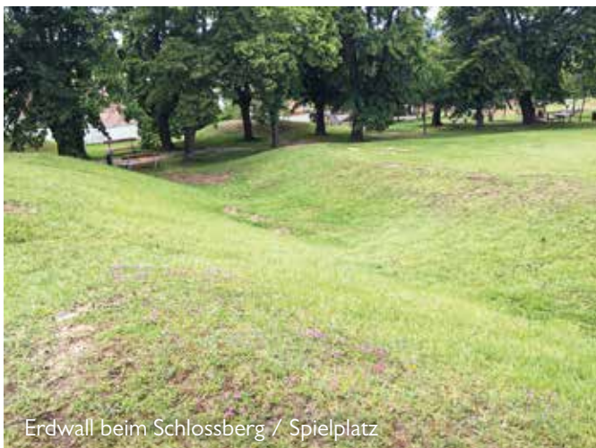
Erdwall beim Schlossberg / Spielplatz