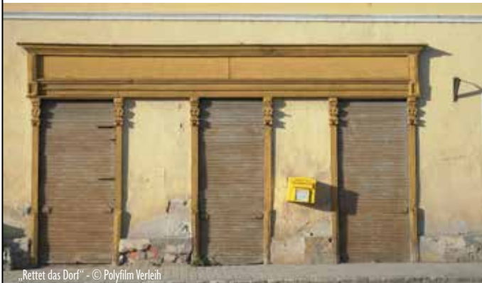
„Rettet das Dorf“

Fr., 30.10.2020, 19:00 Uhr „Rettet das Dorf“, Dokumentarfilm, Ö 2020, 75 min, OF