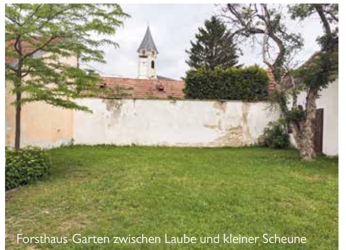
Forsthaus-Garten zwischen Laube und kleiner Scheune