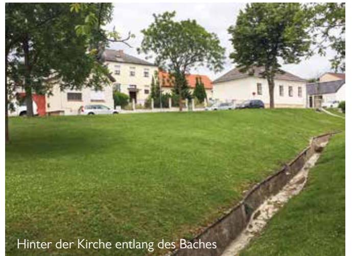
Hinter der Kirche entlang des Baches