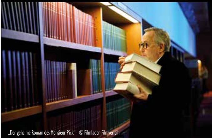
„Der geheime Roman des Monsieur Pick“

Edie hat sich ihr Leben lang nach den Bedürfnissen anderer gerichtet. Als ihre Tochter Nancy sie in ein Altersheim stecken will, beschließt die 83-jährige, ihr Leben selbst in die Hand zu nehmen und sich einen fast vergessenen Traum zu erfüllen: den Berg Suilven in den schottischen Highlands zu erklimmen. „Edie“, mit der brillanten Sheila Hancock in der Hauptrolle, erzählt von verpassten Chancen, der Erfüllung lang gehegter Träume und vom Mut, den eigenen Weg zu gehen.