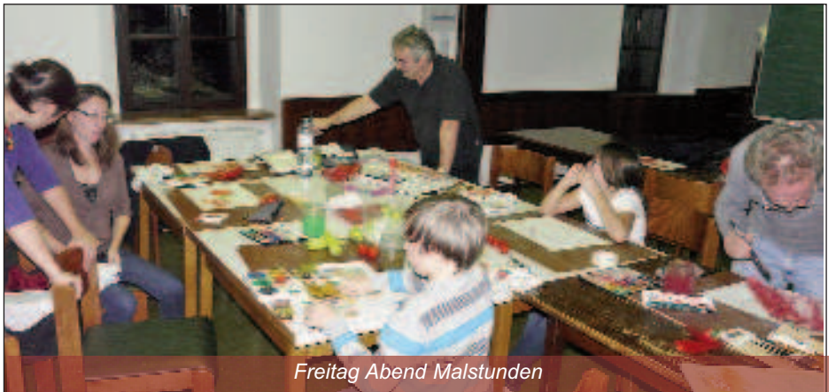
Freitag Abend Malstunden