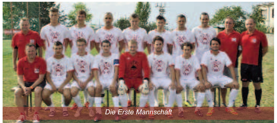
Die Erste Mannschaft

Sportlerball 2013 im Forsthaus (26.01.2012)