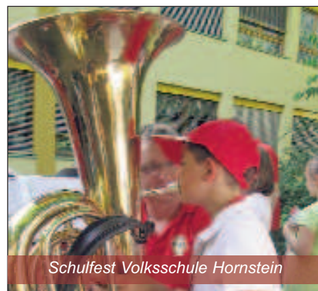
Schulfest Volksschule Hornstein