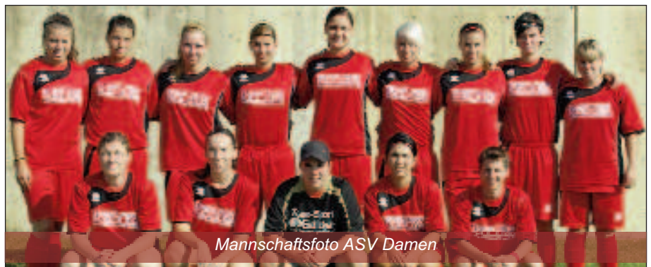
Mannschaftsfoto ASV Damen

Leider musste man bei wichtigen Spielen immer wieder einige Leistungsträger vorgeben. Man bestritt oft sehr gute Spiele, aber leider verlor man auf Grund der mangelnden Chancenauswertung. Die Mädels beweisen in solchen Spielen immer wieder tolle Moral und Kampfeswille, das Glück blieb aber meist auf der Seite des Gegners. So steht nach Abschluss der Herbstsaison in der 2. Liga Ost/Süd am 11. Tabellenplatz. Man konnte 1 Sieg erringen, 2 Remis erspielen und musste leider 8 Niederlagen einstecken. Sollte das Glück auch wieder mal auf die Hornsteiner Seite zurückkehren, so sind sich die Trainer sicher, dass man im Frühjahr mit den schon sehr guten Spielphasen auch wieder mehr Punkte einfahren wird als im Herbst.