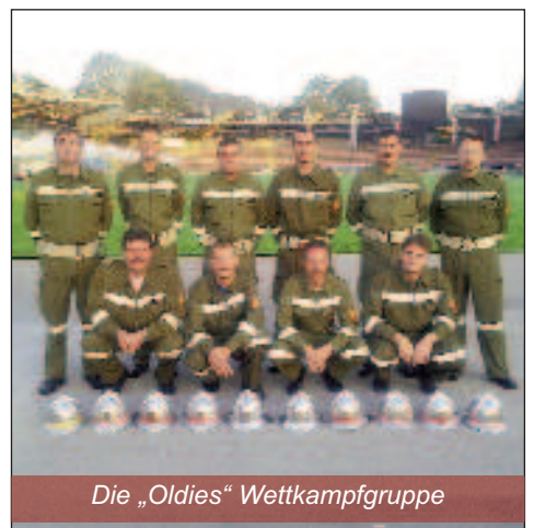
Die „Oldies“ Wettkampfgruppe

In der fantastischen Atmosphäre der Linzer Gugl konnte die Wettkampfgruppe der Freiwilligen Feuerwehr Hornstein als beste bgld. Gruppe den 14. Gesamtrang in der Wertung Bronze B und den 10. Gesamtrang in der Wertung Silber B erreichen.