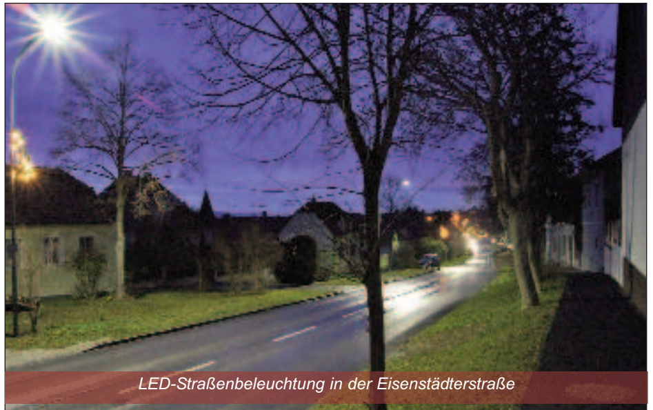
LED-Straßenbeleuchtung in der Eisenstädterstraße

Die Umstellung der gesamten Straßenbeleuchtung auf LED-Technologie bringt vor allem mehr Licht und damit mehr Sicherheit auf Hornsteins Straßen bei