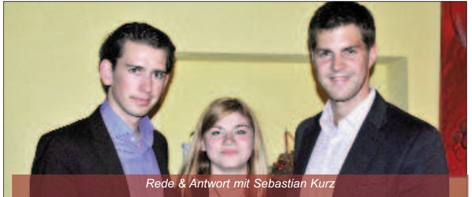
Rede & Antwort mit Sebastian Kurz