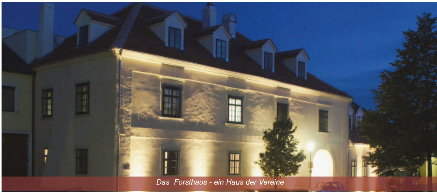
Das Forsthaus - ein Haus der Vereine

A m Samstag, dem 15.09.2012, wurde um 15.00 Uhr das neu renovierte Forsthaus eröffnet. Bürgermeister Herbert Worschitz konnte neben vielen Hornsteinerinnen und Hornsteinern auch zahlreiche Ehrengästen begrüßen. Das renovierte Esterházyische Forsthaus ist ein Haus der Vereine, wo zahlreiche Vereine (z.B. Tamburizza, Schachklub und Pensionisten) untergebracht werden. Auch die Hornsteiner Bücherei wird einen neuen Platz im Forsthaus bekommen. Der teilweise als Zubau errichtete Kultursaal soll den Vereinen für kulturelle Veranstaltungen offen stehen und Impulse für eine Ausweitung des Kulturangebots in Hornstein setzen. Aufgrund der guten Akustik und der modernen Ausstattung an Gastro- und Veranstaltungstechnik (Küchenausstattung, Licht- und Ton-