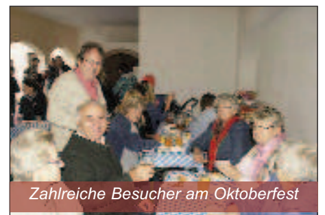
Zahlreiche Besucher am Oktoberfest