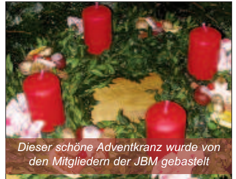
Dieser schöne Adventkranz wurde von den Mitgliedern der JBM gebastelt

Am Samstag, 19. Jänner findet unser alljährlicher Musikerball mit der Musikgruppe „die Steps“ im Pfarrsaal statt. Danach wird die JBM Hornstein in Amt und Würden und natürlich in Verkleidung am Faschingsumzug am 9. Februar teilnehmen. Immer aktuelle Informationen und Termine auf unserer Homepage www.jbmhornstein.at