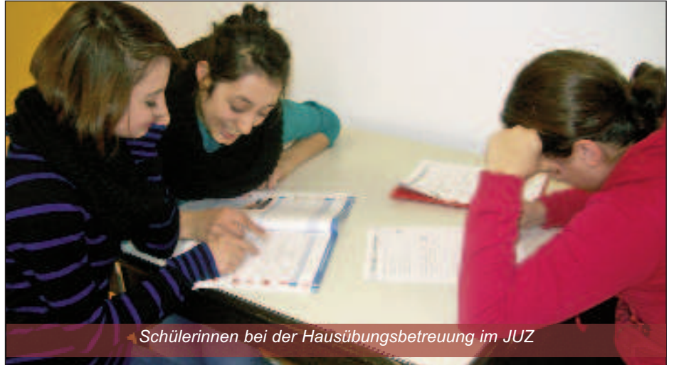
• Schülerinnen bei der Hausübungsbetreuung im JUZ