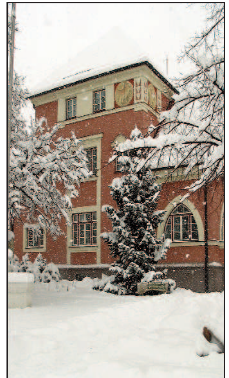
Bürgermeister Herbert Worschitz

Besuchen Sie uns auch im Internet unter www.hornstein.at