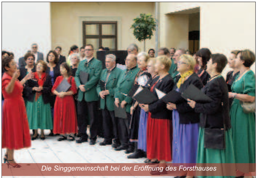
Die Singgemeinschaft bei der Eröffnung des Forsthauses

Auch im vergangenen Jahr haben wir Ihnen hoffentlich bei verschiedenen Anlässen die Schönheit des Singens vor Augen geführt – oder besser gesagt „vor die Ohren“ – geführt und Ihnen einige schöne Stunden bereitet. Frohe Weihnacht und einen Prosit 2013 wünscht die Singgemeinschaft