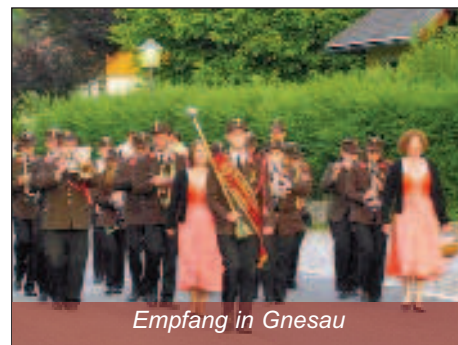
Empfang in Gnesau

Nach einem erfrischenden Festakt durften wir endlich den Frühschoppen spielen. Mit Hilfe der Musikantenkollegen aus Zedlitzdorf und unserer Marketenderinnen war das Festzelt bald am Brodeln. Irgendwann waren dann Hunger und Durst doch stärker und wir konnten die Bühne mit gutem Gewissen weiterreichen. Die Partnerkapelle unterhielt uns dann aber doch zu gut – und so wollte mancher Hornsteiner einfach nicht mehr mit dem Bus heimfahren.