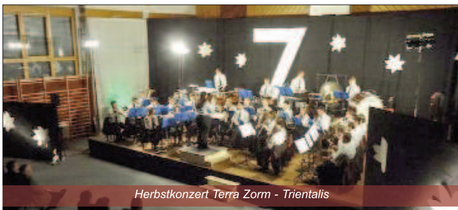
Herbstkonzert Terra Zorm - Trientalis

A m 15. Juni sorgte die JBM Hornstein für die musikalische Untermalung bei dem Schulfest der VS Hornstein. Natürlich durften die Schülerinnen und Schüler diese Gelegenheit gleich nutzen und die verschiedenen Instrumente bei uns ausprobieren. Interessierte junge Burschen und Mädchen gab es genug – mal sehen, wer in den nächsten Jahren mitten unter uns sitzt.