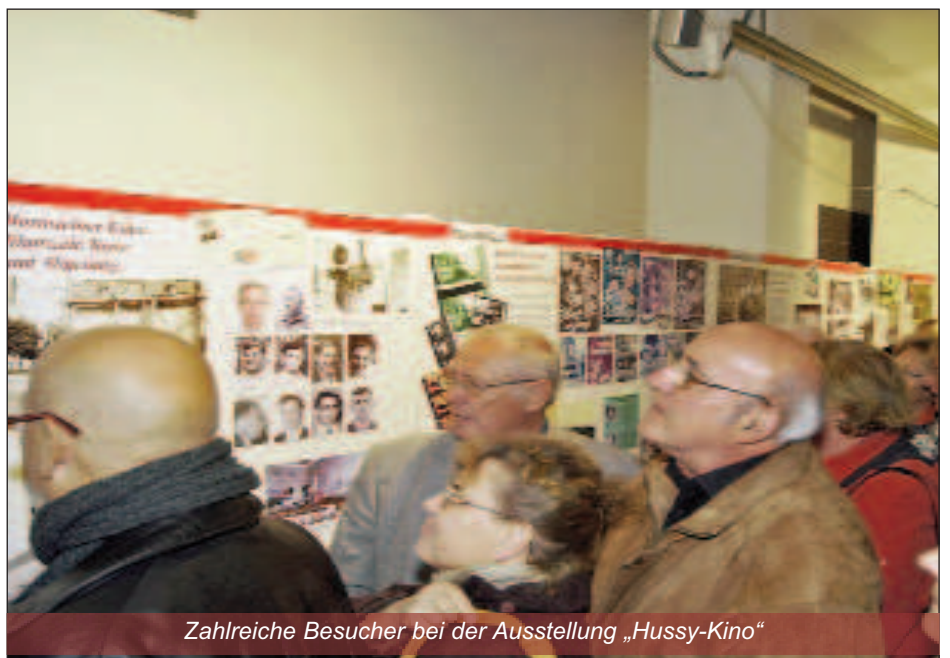
Zahlreiche Besucher bei der Ausstellung „Hussy-Kino“

che Freizeitgestaltung. Mit einem Büffet der Gemeinde Hornstein für alle Besucher schloss die Eröffnung. Das Volksgruppen-Fernsehen brachte am 18. November einen ausführlichen Bericht über die Ausstellung.