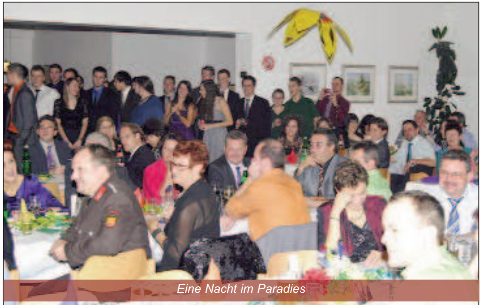
Eine Nacht im Paradies

Die Freiwillige Feuerwehr Hornstein sagt allen Hornsteinerinnen und Hornsteinern herzlich Dankeschön für die große Unterstützung in diesem Jahr!