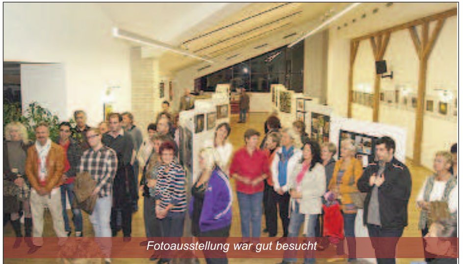
Fotoausstellung war gut besucht

Die gezeigte Vielfalt wurde mit einem regen Besuch der Ausstellung belohnt, und man kann schon gespannt auf die nächste Ausstellung sein. Die alljährliche Fotoausstellung ist inzwischen zu einem fixen Bestandteil Hornsteiner Dorfkultur geworden, um den wir uns von anderen Gemeinden gerne beneiden lassen.