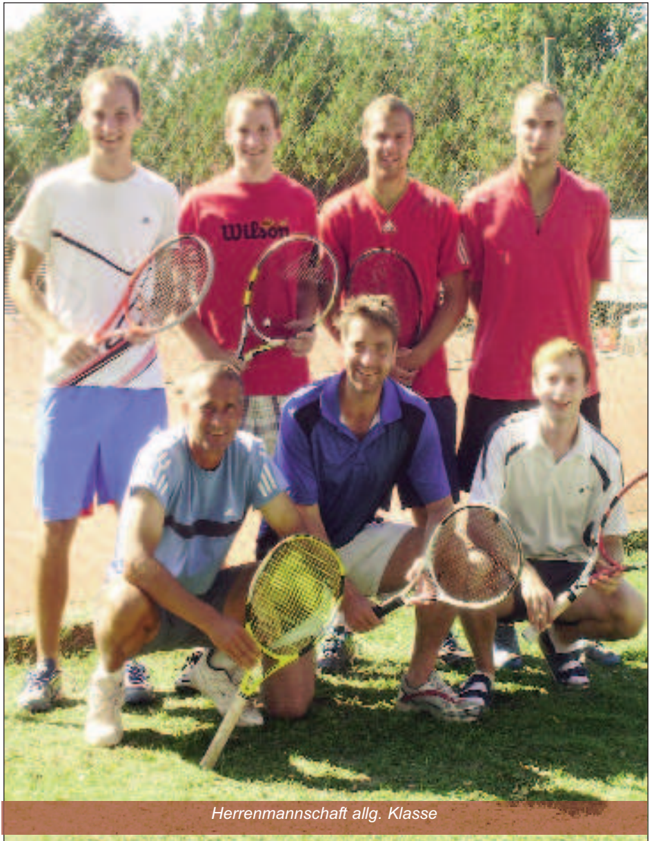
Herrenmannschaft allg. Klasse

Wir würden uns freuen, Sie und Ihre Kinder im nächsten Jahr bei einem „Schnupperstündchen“ auf der Tennisanlage des ASKÖ TC-Hornstein begrüßen zu dürfen.