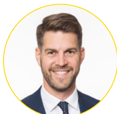
Ihr Bürgermeister Christoph Wolf