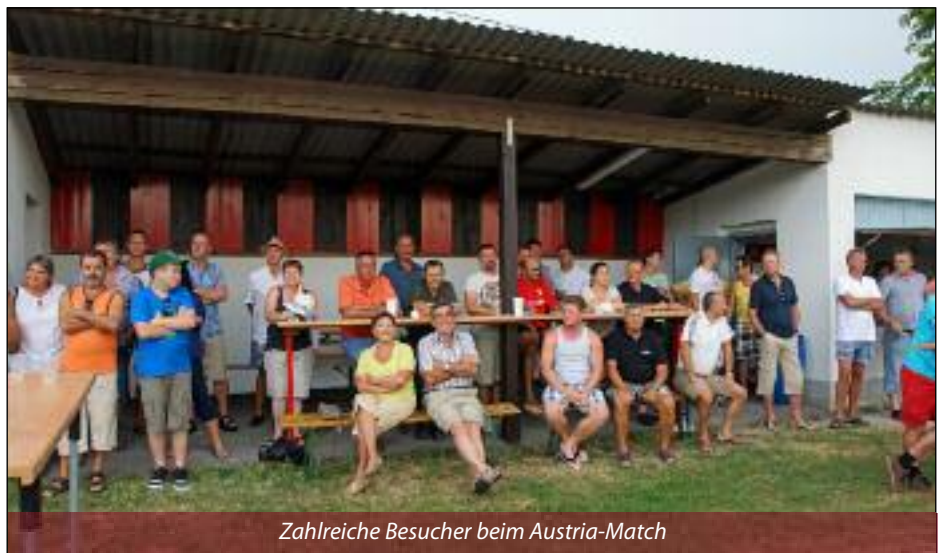
Zahlreiche Besucher beim Austria-Match