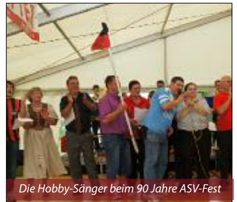
Die Hobby-Sänger beim 90 Jahre ASV-Fest