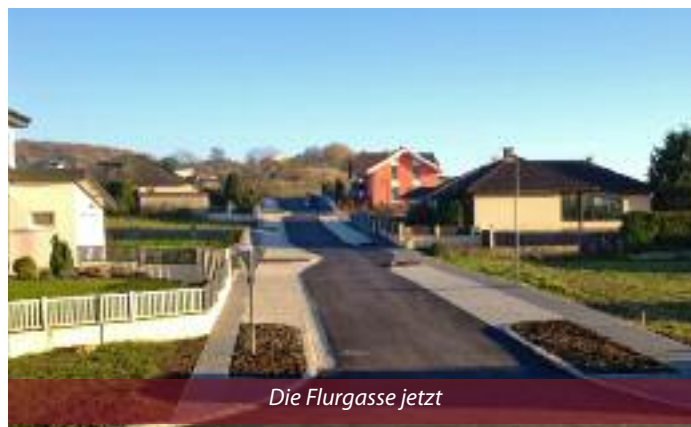
Die Flurgasse jetzt