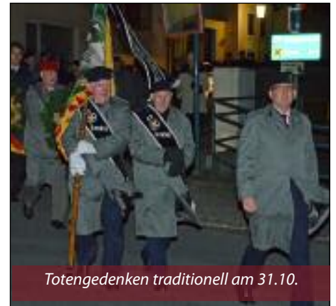
Totengedenken traditionell am 31.10.

Der Kameradschaftsbund Hornstein wünscht allen Hornsteinerinnen und Hornsteinern ein gesegnetes Weihnachtsfest und einen guten Rutsch ins Jahr 2014.