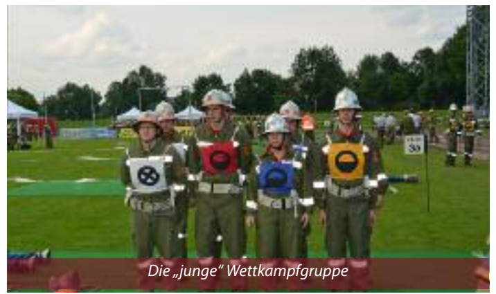
Die „junge“ Wettkampfgruppe