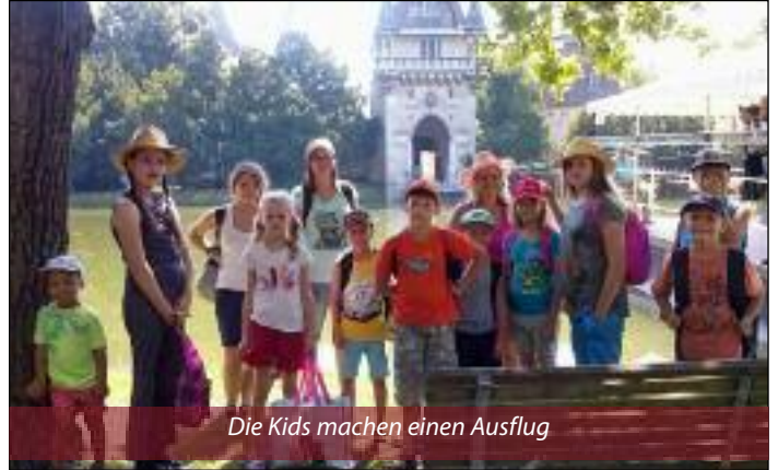
Die Kids machen einen Ausflug