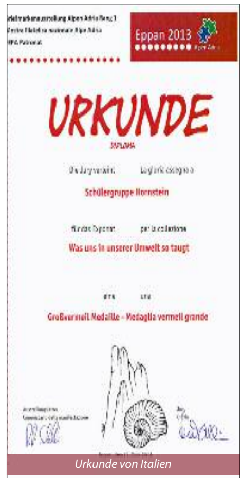
Urkunde von Italien