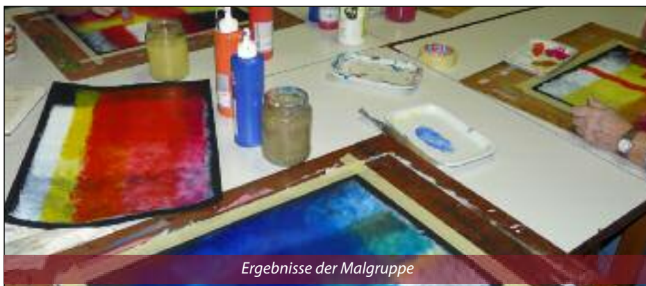
Ergebnisse der Malgruppe

Im Vorjahr konnte die Gruppe im Rahmen einer großen Ausstellung ihr 25jähriges Jubiläum feiern, und an der nächsten gemeinsamen Ausstellung wird schon fleißig gearbeitet.