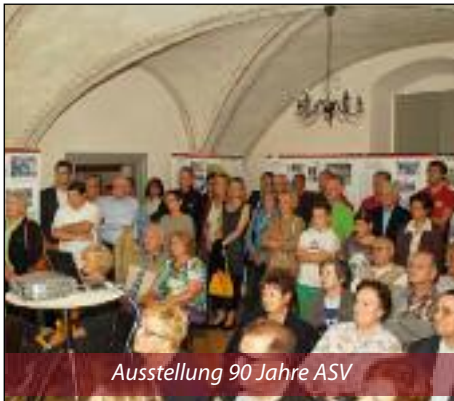
Ausstellung 90 Jahre ASV

25.1.2014: Sportlerball des ASV Hornstein im Forsthaus