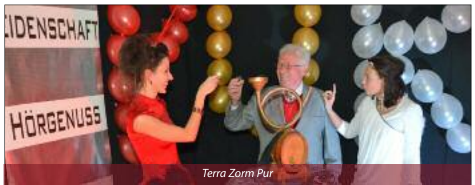
Terra Zorm Pur

A m 19. Oktober war es dann endlich wieder so weit: Das pure Terra Zorm Konzert war angekommen. Unsere Probe-Mühen der letzten Wochen fanden ihren Höhepunkt in einem puren Herbstkonzert und wurden mit tosendem Applaus und Standing Ovationen für die Musik und das Konzept „Musik PUR“ belohnt. Danach feierten wir noch gemeinsam mit dem Publikum in den Räumlichkeiten der Volksschule und in der Galerie des Turnsaales unseren Erfolg.