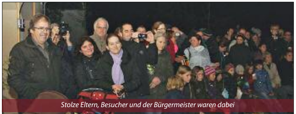
Stolze Eltern, Besucher und der Bürgermeister waren dabei