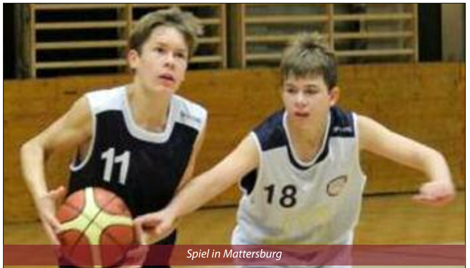
Spiel in Mattersburg

BK Mattersburg Rocks – datasys BC Hornstein Dragonz 29:55 (4:10, 14:18, 22:34; 29:55)