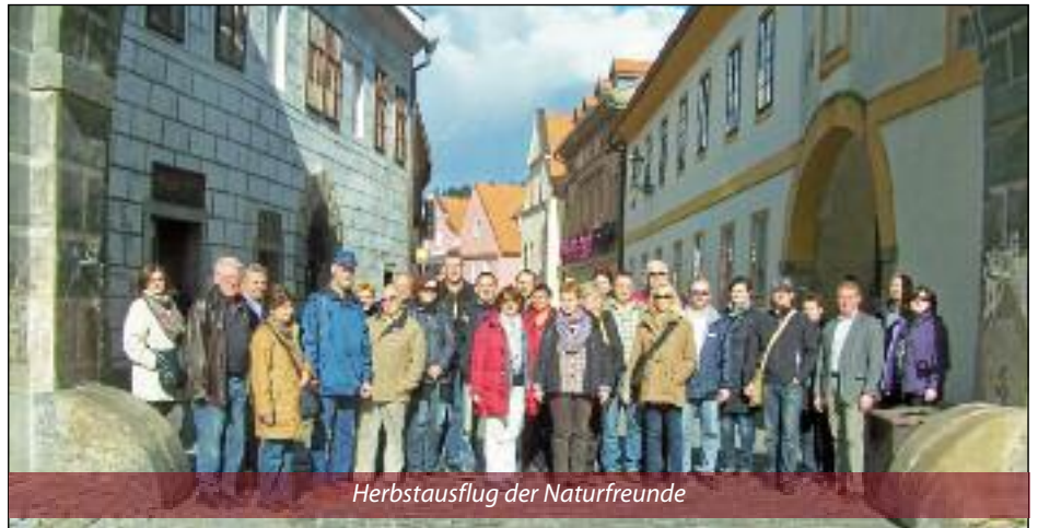
Herbstausflug der Naturfreunde

A m 12. und 13. Oktober führte der Herbstausflug der Naturfreunde Hornstein ihre Mitglieder in die tschechischen Städte Budweis und Krumau. Nach der Stadtführung in Budweis besuchten sie die älteste Brauerei in der Stadt, in welcher sie einiges Wissenswertes rund um die Kultur der faszinierenden Hopfenpflanze erfahren konnten. Aus der Vielfalt der Biersorten wurde die eine oder andere verkostet. Am zweiten Tag lernten sie das wunderschöne Städtchen Krumau kennen. Diese malerische Stadt an der Moldau hat alle fasziniert und verdient den Namen „die Perle des Böhmerwaldes“.