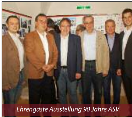
Ehrengäste Ausstellung 90 Jahre ASV