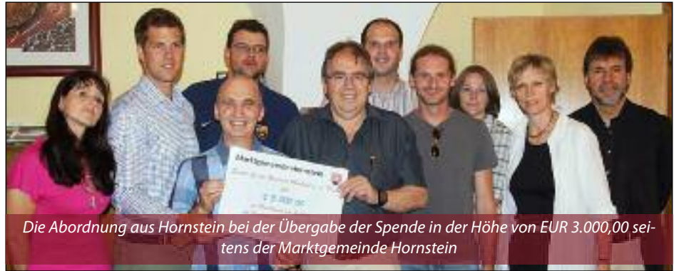
Die Abordnung aus Hornstein bei der Übergabe der Spende in der Höhe von EUR 3.000,00 seitens der Marktgemeinde Hornstein

Hornstein EUR 3.000,00 entsprechend dem Beschluss des Gemeinderates. Auch die SPÖ-Gemeinderäte von Hornstein übergaben eine Spende in der Höhe von € 570,00.