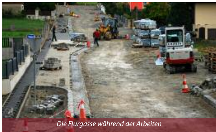
Die Flurgasse während der Arbeiten

Anrainer wurde dieses Projekt mit einem Beschluss in der heurigen Juli-Gemeinderatsitzung umgesetzt.