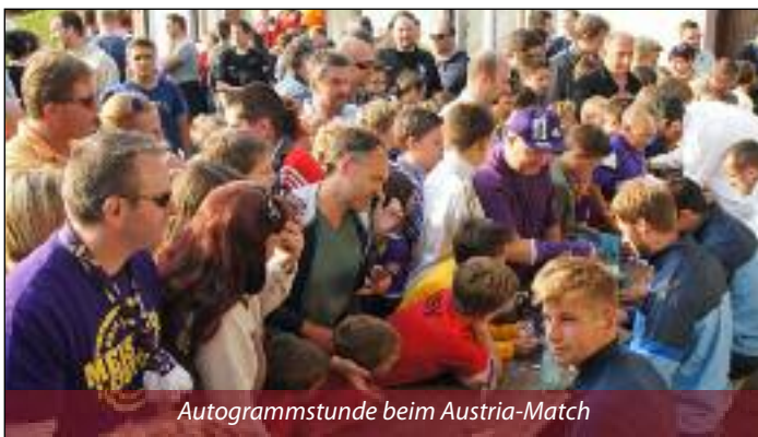
Autogrammstunde beim Austria-Match