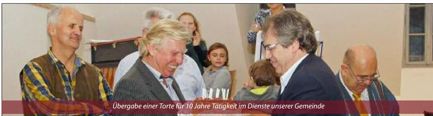
Übergabe einer Torte für 10 Jahre Tätigkeit im Dienste unserer Gemeinde