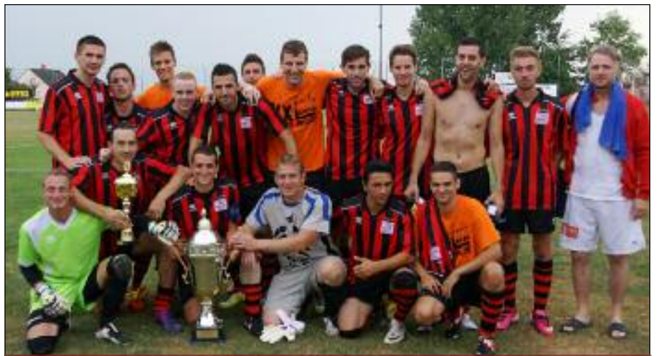
Unsere Mannschaft gegen FK Austria Wien