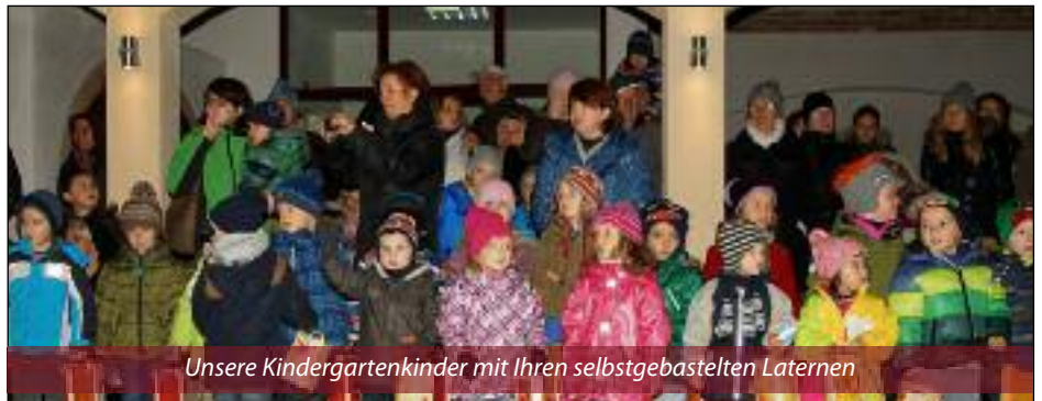
Unsere Kindergartenkinder mit Ihren selbstgebastelten Laternen

Nach den Darbietungen der Kinder gab es für alle heiße Getränke und Süßes.