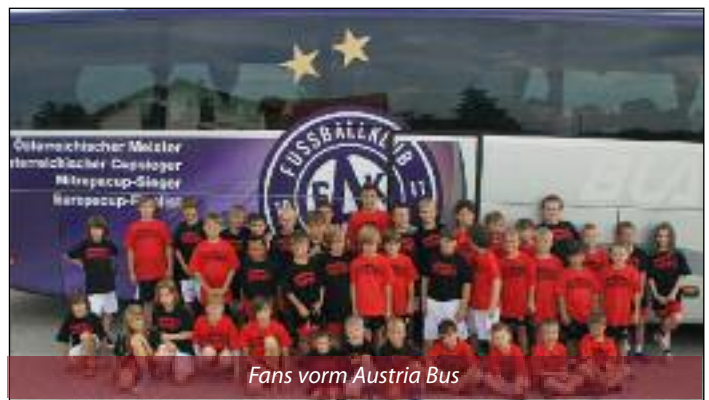
Fans vorm Austria Bus