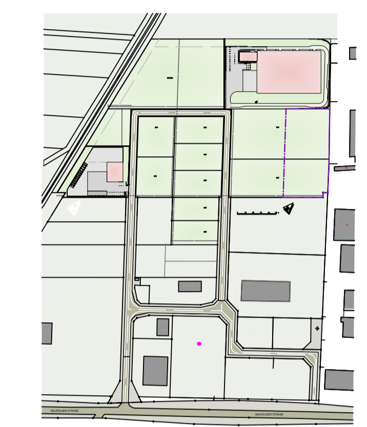
LAGEPLAN M 1:2000