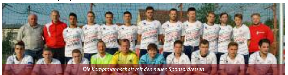
Die Kampfmannschaft mit den neuen Sponsordressen

24.1.2015: Sportlerball des ASV Hornstein im Forsthaus