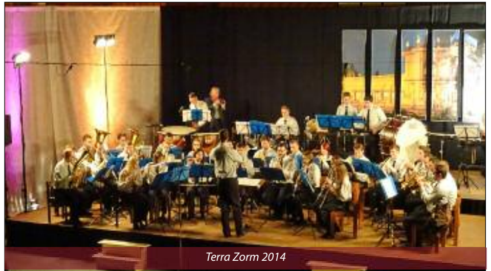
Terra Zorm 2014