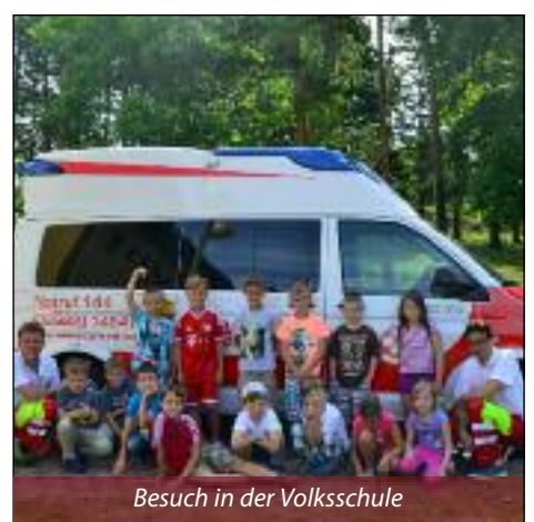
Besuch in der Volksschule