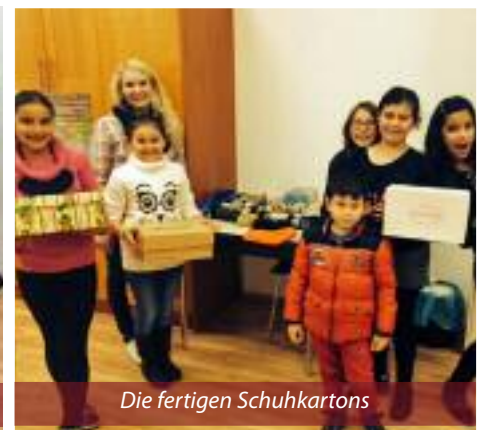
Die fertigen Schuhkartons