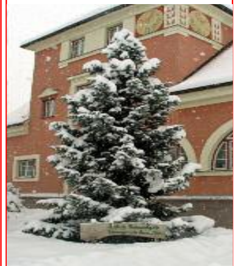
Unser Rathaus im Winter

Die Marktgemeinde Hornstein gratuliert recht herzlich allen Jubilaren!