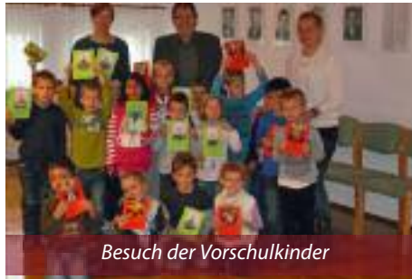
Besuch der Vorschulkinder

A m Donnerstag, dem 30. Oktober 2014, besuchten die Vorschulkinder des Kindergartens unseren Bürgermeister im Rathaus. Die Kinder waren zu einer leckeren Jause geladen. Es gab Putenwurst-, Käsesemmeln und Getränke. Anschließend unterschrieb und stempelte Bürgermeister Herbert Worschitz die Buchausweise der Vorschulkinder, um sich von der kindergarteneigenen Bücherei Bücher ausleihen zu können.