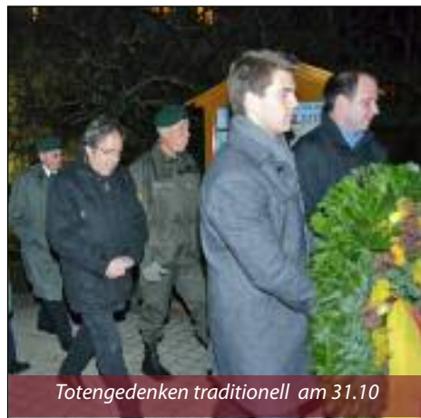
Totengedenken traditionell am 31.10

Der Kameradschaftsbund Hornstein wünscht allen Hornsteinerinnen und Hornsteinern ein gesegnetes Weihnachtsfest und einen guten Rutsch ins Jahr 2015