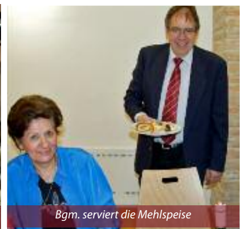
Bgm. serviert die Mehlspeise