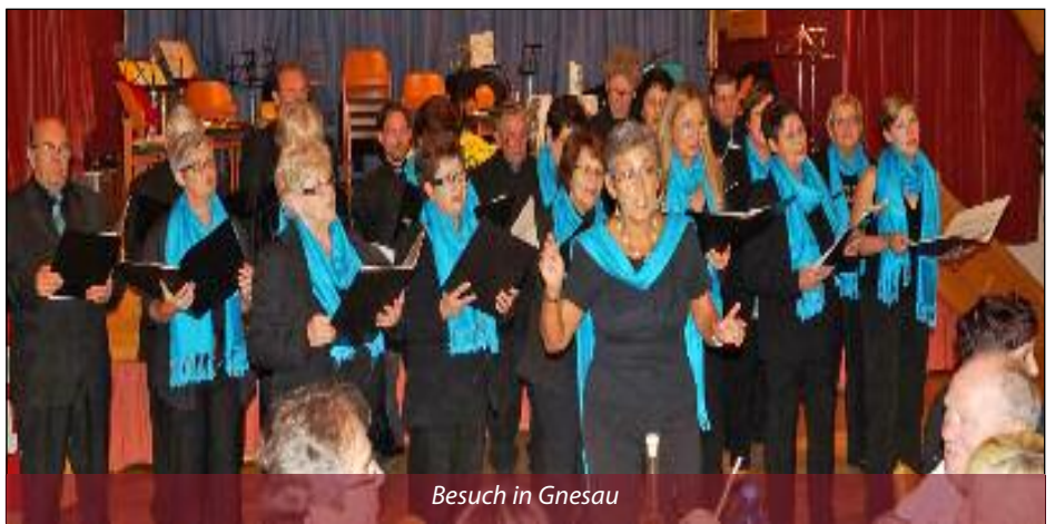
Besuch in Gnesau