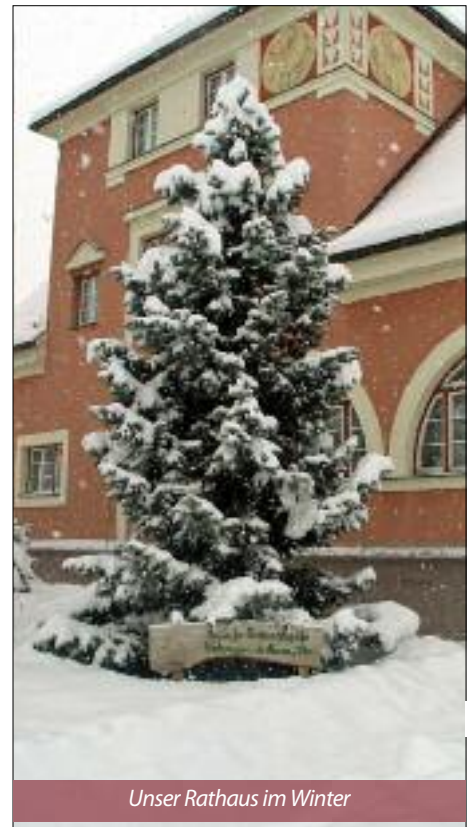
Unser Rathaus im Winter