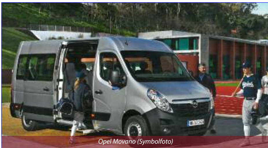
Opel Movano (Symbolfoto)