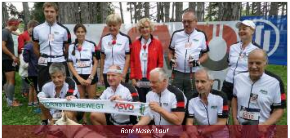
Rote Nasen Lauf