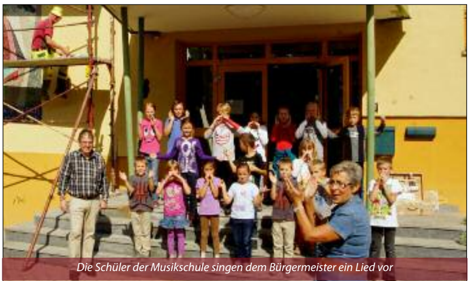
Die Schüler der Musikschule singen dem Bürgermeister ein Lied vor

S chüler und Lehrer freuen sich! Endlich mehr Platz in der Schule! Der Neubau des Kindergartens hat auch uns „neue“ Klassen gebracht. Ein Raum nur für uns alleine und ein zweiter, den wir auch sehr viel nutzen können, bereitet uns große Freude in unserer Arbeit. Auch die keramischen Schriftzüge für Volks- und Musikschule sind sehr dekorativ an der Fassade. Wir danken den Vertretern der Gemeinde dafür und freuen uns schon, dass auch der Schlagzeugunterrichtsraum sehr bald fertig sein wird. Für viele Konzerte, Klassenabende, Wettbewerbsteilnahmen unserer Schüler wird auch schon fleißig geübt. Viel Freude beim Zuhören, ein Frohes Weihnachtfest und ein Gutes Neues Jahr wünschen Lehrer, Schüler und Direktion der Musikschule!