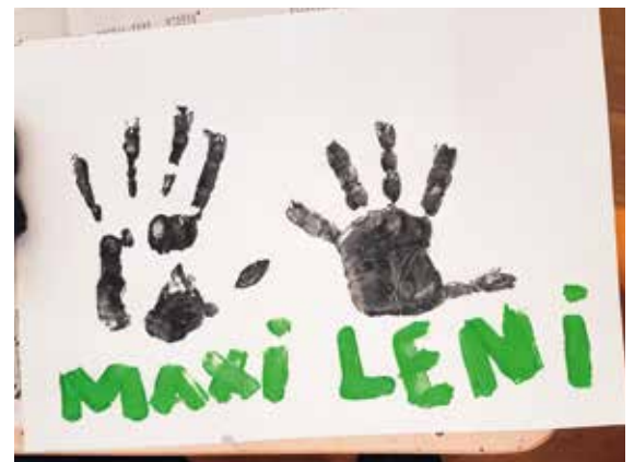
Maxi und Leonie