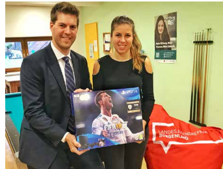
Ab sofort kann im Jugendzentrum nicht nur am reparierten Wuzzler, sondern auch auf einer neuen Playstation4 Fußball gespielt werden.

Auszeichnung. Für das Jugendzentrum wurde eine Playstation 4 inklusive dem neuen Spiel FIFA 18 angeschafft. Das Geld dafür stammt aus den Mitteln des Projekts „Deine Gemeinde - jung.aktiv.innovativ“, bei dem die Marktgemeinde Hornstein ausgezeichnet wurde.