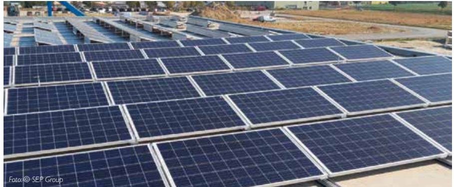
Auf dem Dach des SEP Hallengebäudes wurde 2018 eine Photovoltaik-Anlage errichtet.

Die SEP generiert auch Großaufträge für die Fertigung von Montageanlagen wie z.B. für Scheinwerfer bei Hella. Auch Aufträge für Anlagen zur Montage von Kopfstützenverstellmotoren, Getrieben, Elektronikmodulen und Armaturen sowie Roboterzellen für die Automatisierung von Bearbeitungszentren im Bereich E-Mobility konnte SEP gewinnen. Den Erfolg erklärt sich Haas wie folgt: „Wir sind flexibler als die Großen, gehen gerne auf Sonderwünsche ein, wir sind hochmotiviert und leben bzw. setzen auf Innovation und Qualität.“