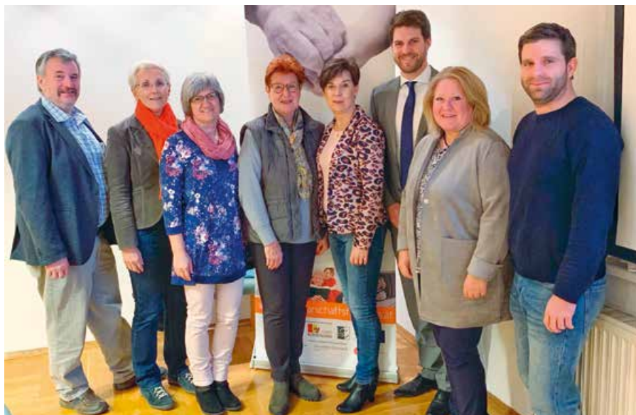
Gründungsvorstand Nachbarschaftshilfe PLUS 2019

Soziale Dienste, wie Fahr- und Begleitsdienste zur medizinischen Versorgung, zu Behörden, gemeinsames Einkaufen oder Spazierengehen werden angeboten, ebenso Besuchsdienste zum Kartenspielen oder plaudern. Die Dienste sind für die Bürger/innen gratis, die Kosten tragen die Partnergemeinden, das Land stellt eine Co-Finanzierung zur Verfügung.