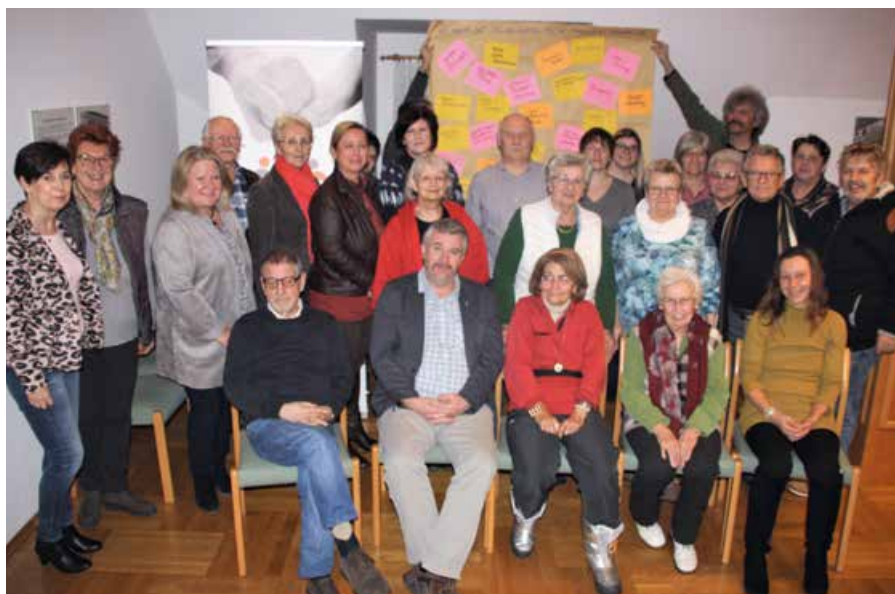
Am 23. Jänner trafen sich die zukünftigen ehrenamtlichen Mitarbeiter/innen aus den beiden Partnergemeinden Hornstein und Müllendorf.

Nunmehr kann das Projekt starten und nimmt die Arbeit ab 1. März 2019 in beiden Gemeinden auf! Wir freuen uns auf viele freiwillige Helfer und viele Anfragen von Menschen, die wir unterstützen können!