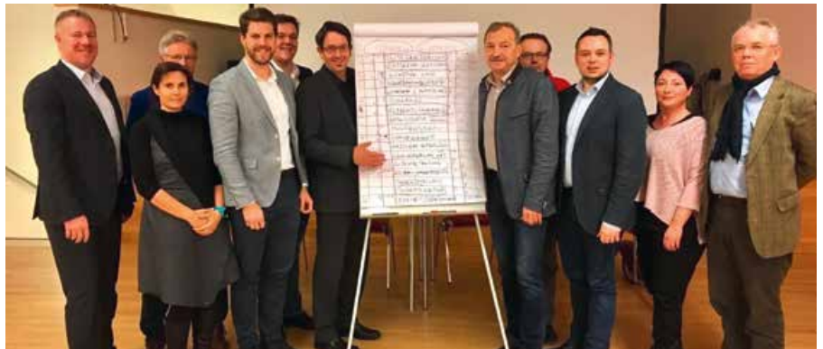
1. Dorfgespräch Hornstein am 18. Jänner 2019.

Dieses Wachstum wollen wir nicht aufhalten, wir möchten es sinnvoll und überlegt zulassen. Das betrifft viele Bereiche, die mit Wachstum zusammenhängen, wie Wohnbau und Anschließungen für Bauplätze, Infrastruktur, kulturelle und ehrenamtliche Entwicklung und Einbindung, Maßnahmen zur Verbesserung und Beruhigung der örtlichen Verkehrsverhältnisse sowie Maßnahmen der Dorfökologie, der dorfgemäßen Gestaltung des Wohnumfeldes und der Landschaftsgestaltung.