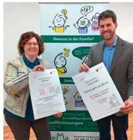
Demenzberatung ab März 2019

Seit Jahresbeginn ist Hornstein gemeinsam mit Müllendorf Teil der Initiative „Nachbarschaftshilfe plus“. Dabei unterstützen 25 ehrenamtliche Helfer Seniorinnen und Senioren im Alltag, beispielsweise durch Einkaufsdienste oder Fahrtendienste.